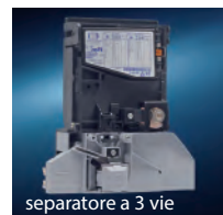
separatori a 3 vie