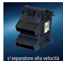
s 2 separatori alta velocità

Caratteristiche e dati tecnici non sono impegnativi e possono variare senza preavviso